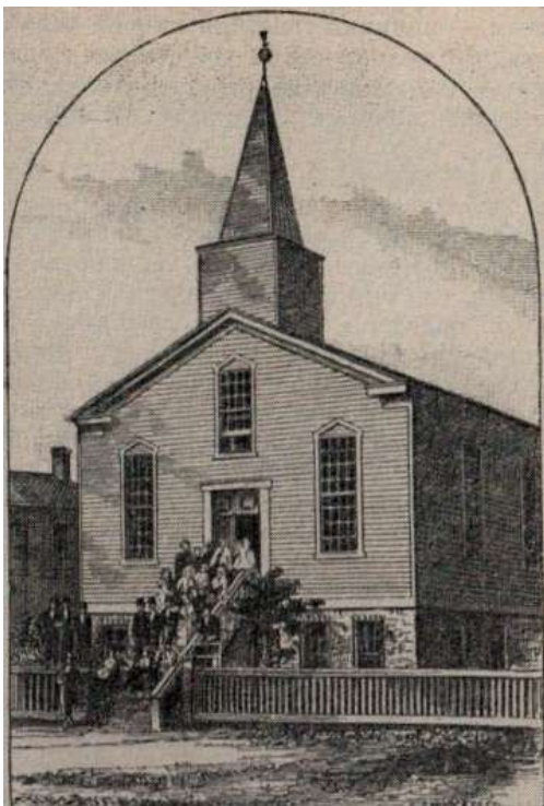
Шведская лютеранский церковь в Чикаго (до пожара)

Итак, протестантизм — это одна из трех главных христианских религий. Разделяя основные особенности развитой религии, т. е. веруя в бытие бога, бессмертие души, сверхъестественный и загробный мир, сверхъестественное откровение и т. п., протестанты так же, как католики и православные, представляют себе бога в качестве триединого бога-отца, бога-сына и бога-святого духа. Иисуса Христа они отождествляют со вторым лицом этой Троицы. Все протестанты верят в богодухновенность Библии.