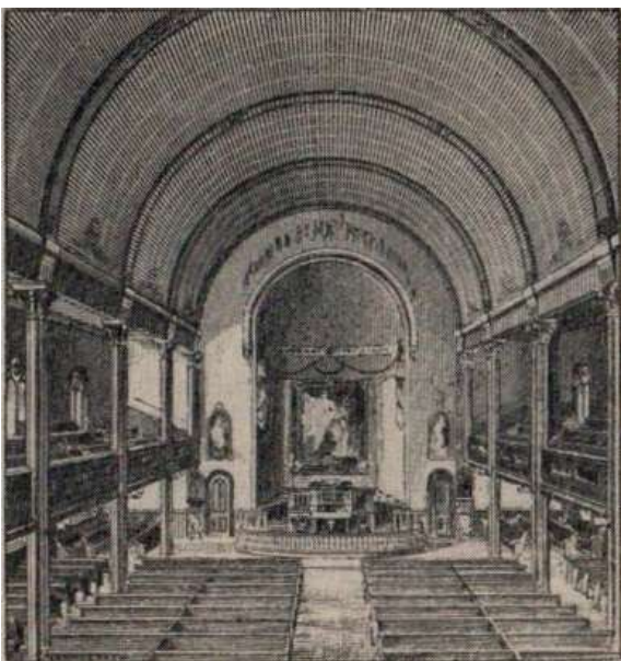
Внутренний вид современной протестантской церкви в США

Библия в протестантизме тоже не на латинском языке, как в католичестве, а в переводах. Чтение и самостоятельное изучение ее — не грех, как для католиков, которым разрешено изучать Священное писание только под руководством священника, а первейшая обязанность, как и обязанность пропаганды библейского учения (в соответствии с принципом священства всех верующих). Протестанты имеют право самостоятельно толковать Библию. Ее авторитет для них выше всех церковных постановлений. В этом состоит третий принцип протестантизма.