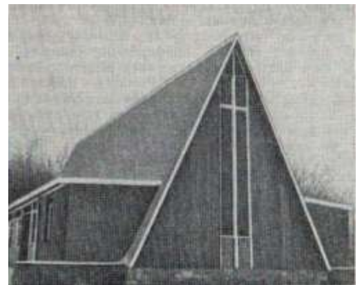
Современная протестантская церковь в США

В связи с тем, что протестантизм более не противостоит католицизму, как буржуазная религия религии феодальной (римская католическая церковь давно нашла себе нового хозяина — капитал), утратили свое значение и три главных протестантских принципа: спасение личной верой, священство всех верующих и исключительный авторитет Священного писания. Никакого жизненного значения в этих принципах больше нет, они действуют по традиции, формально. Во-первых, теперь все протестантские религии имеют свои священные предания (вероисповедания, символы веры, декларации, решения синодов, конференций, съездов, труды основателей протестантских церквей и других авторитетных лиц и т. д. и т. п.). Во-вторых, протестантские церкви, секты и организации, хотя на словах и признают священство всех верующих, их равенство, но на деле все более перестраиваются по авторитарному принципу, что особенно заметно в новых сектах. В протестантских церквях роль духовенства и стоящих над общинами инстанций все более возрастает.