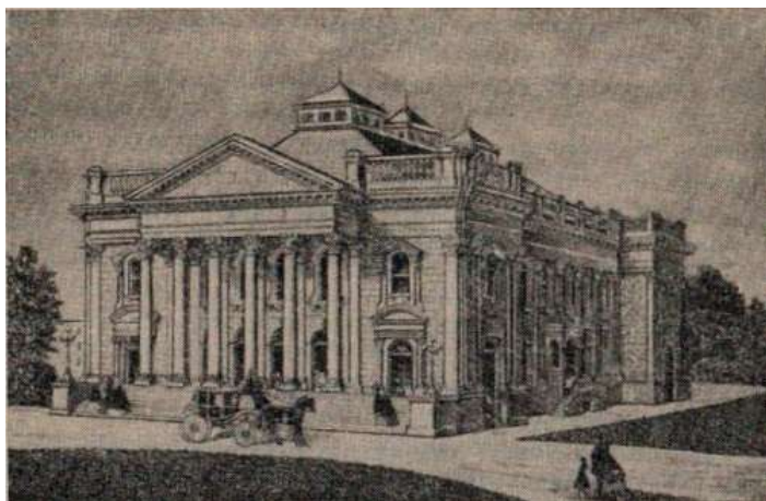
Баптистский молитвенный дом в Лондоне. XIX век

Впрочем, все сказанное относится к идеальному протестантизму. А такового в реальности нет. Учение о протестантизме подобно всеобщей грамматике, под которой разумеется собрание основных правил, без которых грамматика невозможна, но которые, однако, во всей своей чистоте и совершенстве не существуют ни в одном из живых или мертвых языков. Ни одна из живых или мертвых форм протестантизма (а протестантизм это множество протестантских религий) не воплощала эти принципы и особенности полностью и целиком. Эти особенности и эти принципы наличествуют и действуют в различных протестантских религиях по-разному, с разной степенью полноты.